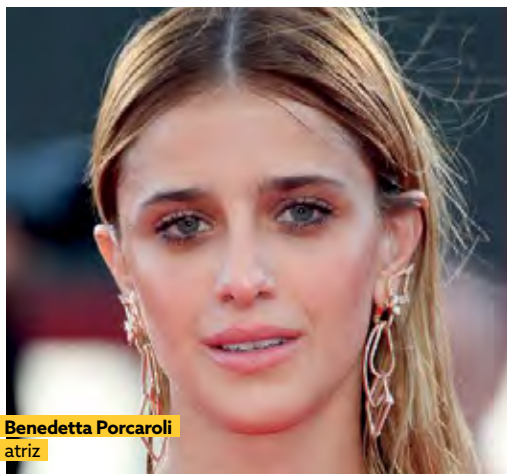
Benedetta Porcaroli atriz