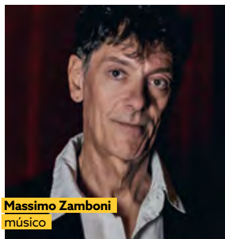
Massimo Zamboni músico