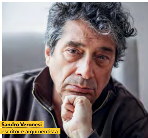
Sandro Veronesi escritor e argumentista