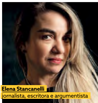
Elena Stancanelli jornalista, escritora e argumentista