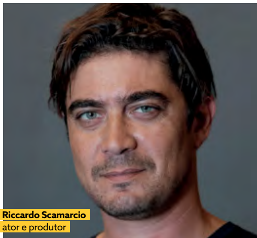
Riccardo Scamarcio ator e produtor